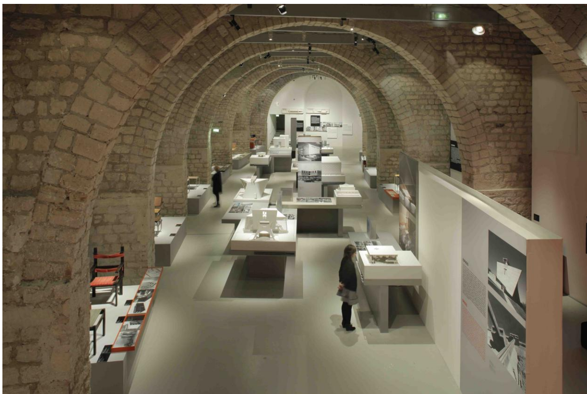
Vue plongeante depuis la mezzanine (actuellement occultée) depuis l'entrée.