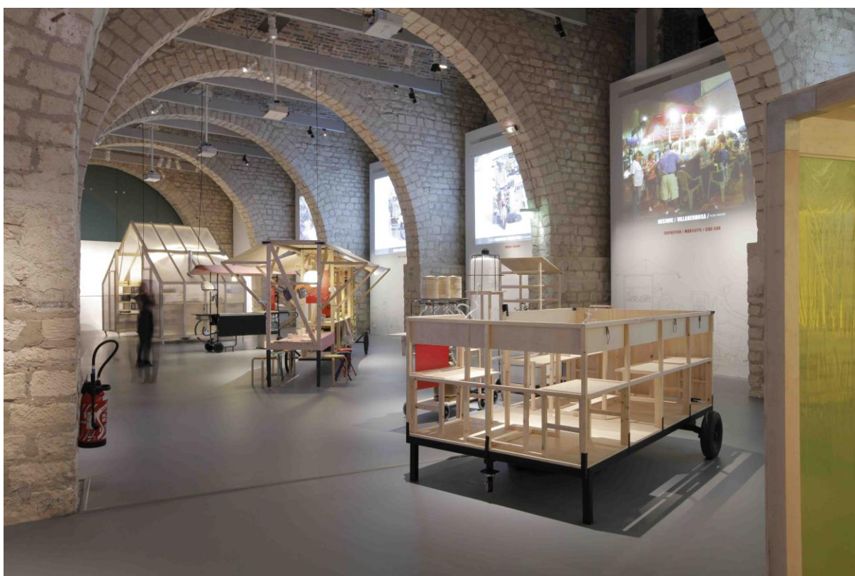
Vue depuis le palier d'escalier au fond à droite de la galerie.