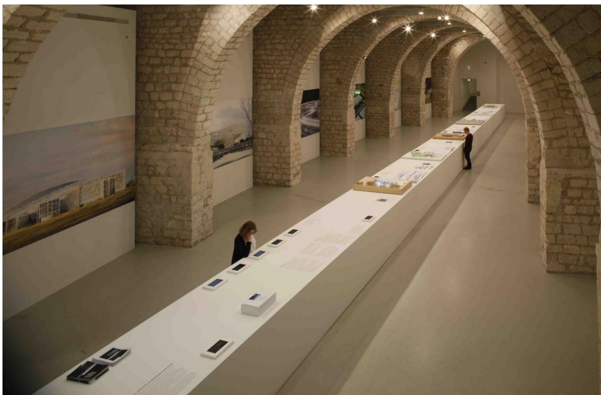
Vue plongeante depuis l'entrée.