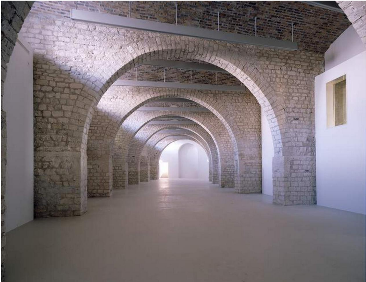
Vue de la galerie vide depuis l'entrée (la niche du fond est actuellement comblée).

Au fond, il y a une issue de secours qui sort sur l'avenue Wilson (à droite) et à gauche il y a une petite pièce de 10 m 2 pouvant servir de salle de projection (palier d'escalier condamné).