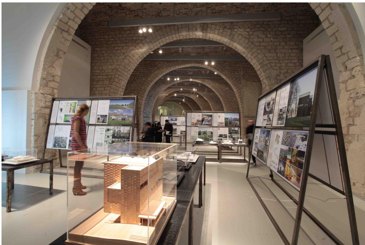
Vue depuis le palier d'escalier au fond à gauche de la galerie.